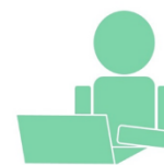
③オンラインテスト