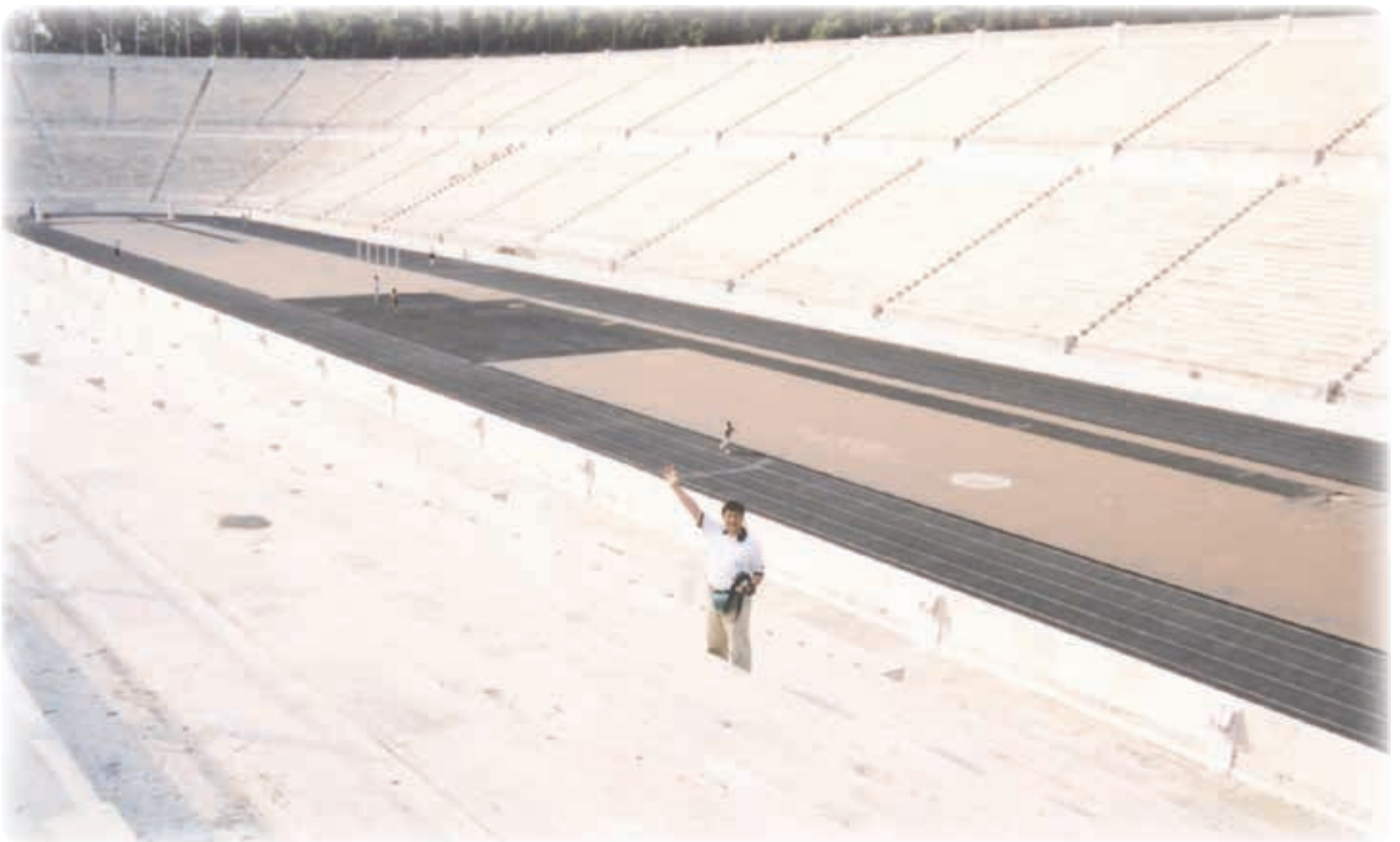
第1回近代オリンピック開催の地：パナシナイコスタジアム(ギリシャ アテネ)

競技選手として、競技能力だけが問われる訳ではありません。スポーツを始めたときにスポーツマンシップが備わっている訳でもありません。練習を重ねるうちに何が重要なのか?自ら気付きます。師を真似、そこから学び、そして新たな自分を創造してゆく過程で自然に生まれます。スポーツは「礼に始まり、礼に終わります」これが基本です。そして、「心・技・体」が鍛えられてゆく過程でスポーツマンシップが宿ります。スポーツの価値は Excellence (卓越性)、Friendship (友情)、Respect (尊敬) にあります。